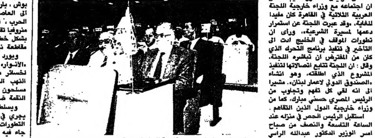
الرئيس الحص في مؤتمر وزراء خارجية الدول الاسلامية، وال جنبه السفير عبد الرحمن الصلح ومستشاره الاعلامي سمير منصور.